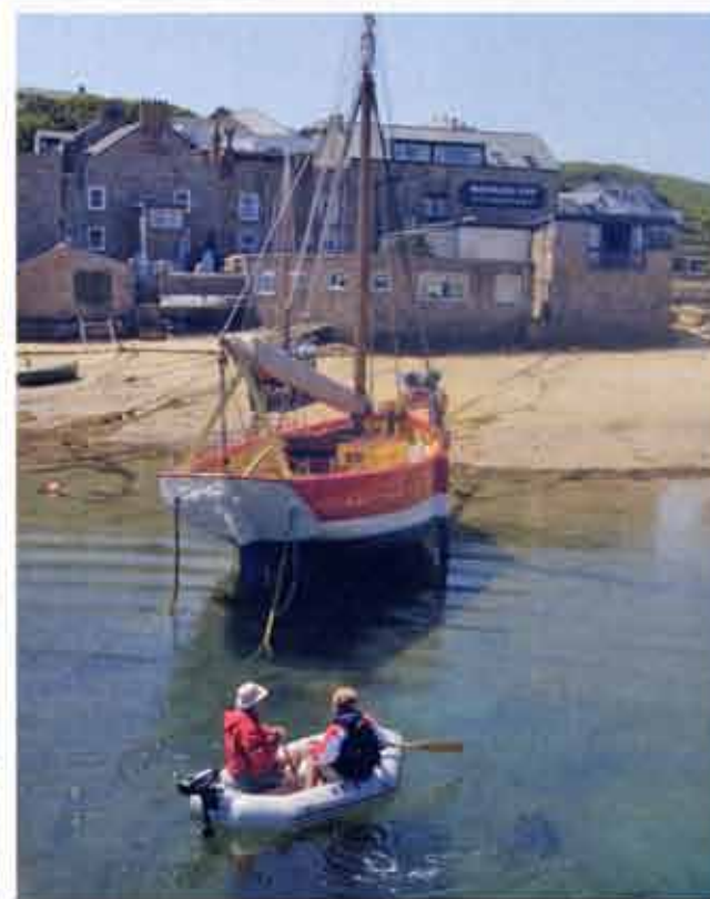
onder: Uitzicht op Mermaid Inn op St-Mary's