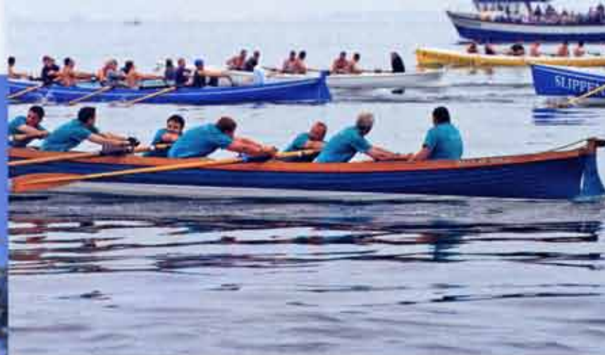
boven: Tegenwoordig is gig-racing een lokale sport. Vroeger werden drenkelingen en scheepsbuit er mee opgepikt